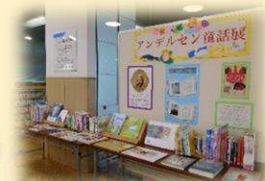
▲アンデルセン童話展