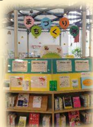
◀まちなかイベント展