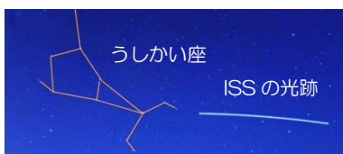
5月21日・金井宇宙飛行士さんが乗っていたISSの光跡