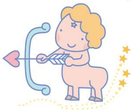
8月中旬午後9時頃の星空